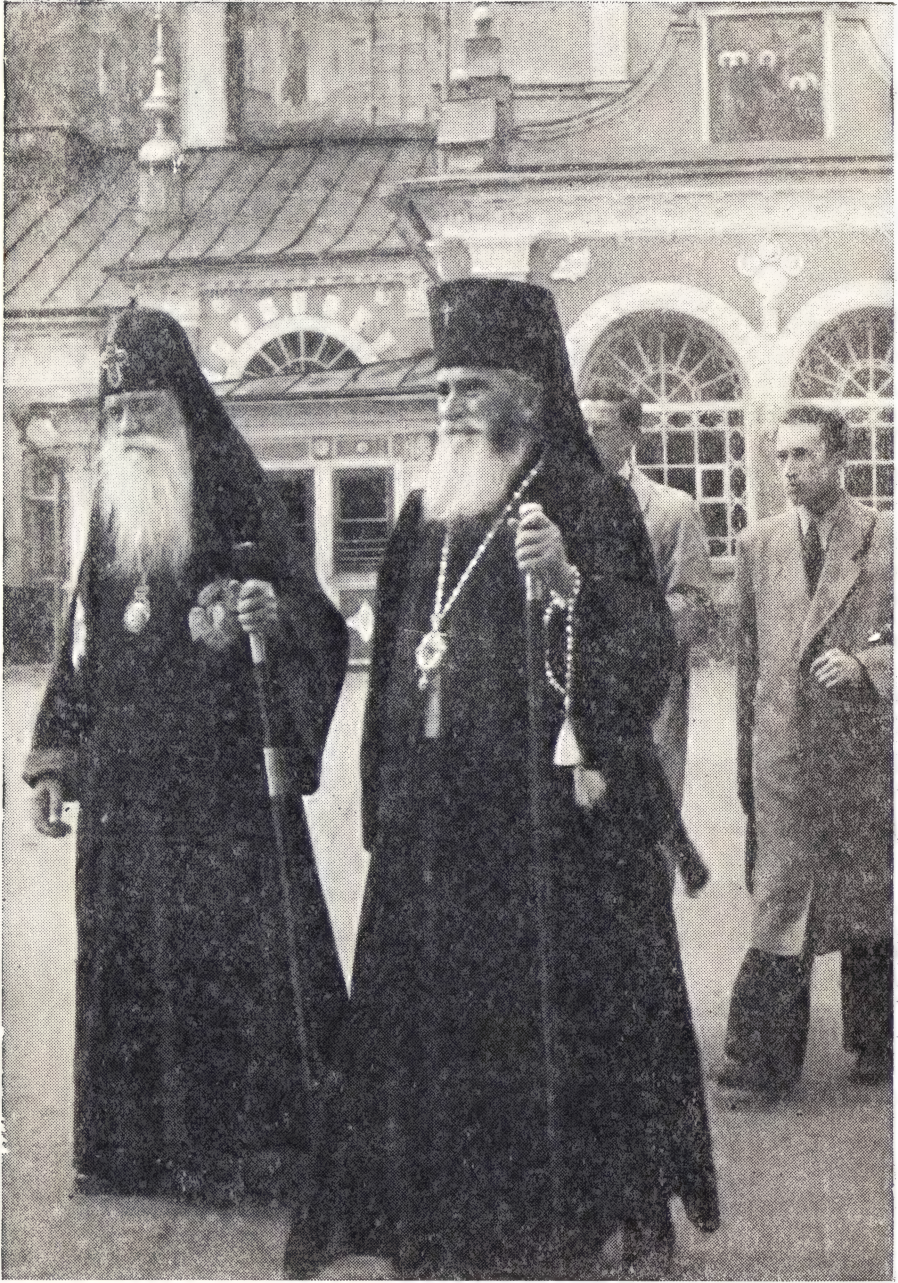
КАТОЛИКОС-ПАТРИАРХ ВСЕЯ ГРУЗИИ МЕЛХИСЕДЕК И МИТРОПОЛИТ МОЛДОВЫ И СУЧЕВЫ СЕВАСТИАН